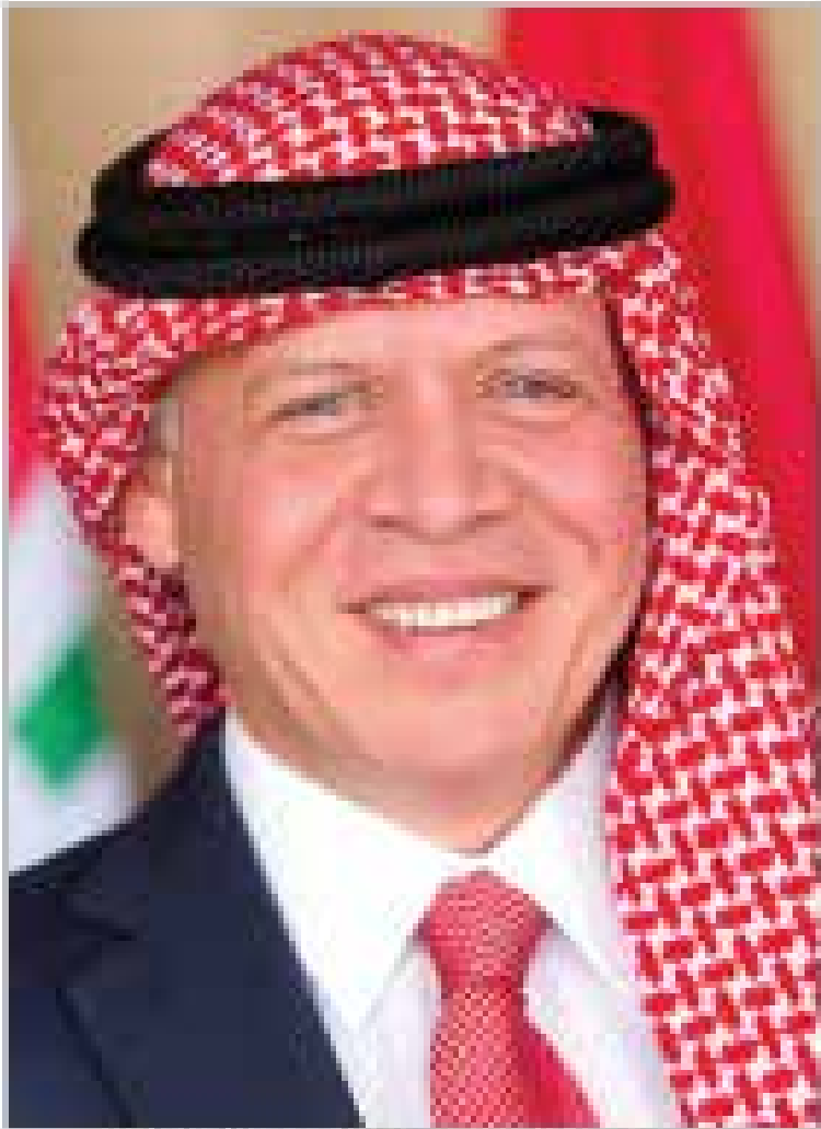
صاحب الجلالة الملك عبد الله الثاني ابن الحسين المعظم