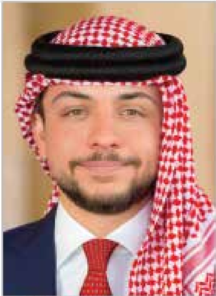
حضرة صاحب السمو الملكي ولي العهد الأمير الحسين بن عبد الله الثاني المعظم