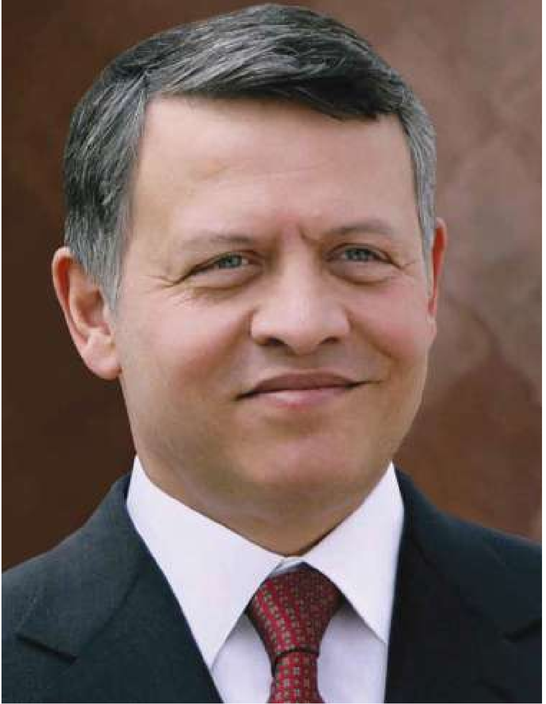
حضرة صاحب الجلالة الهاشمية الملك عبدالله الثاني بن الحسين المعظم